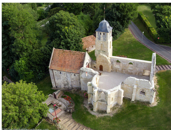
LE PRIEURÉ DE SAINT-ARNOULT

186 ème Site Clunisien admis par la Fédération Européenne des Sites Clunisiens, depuis le 01 octobre 2015, membre du grand itinéraire Culturel des Sites Clunisiens en Europe, patronné par le Conseil de l'Europe, le seul en Normandie !