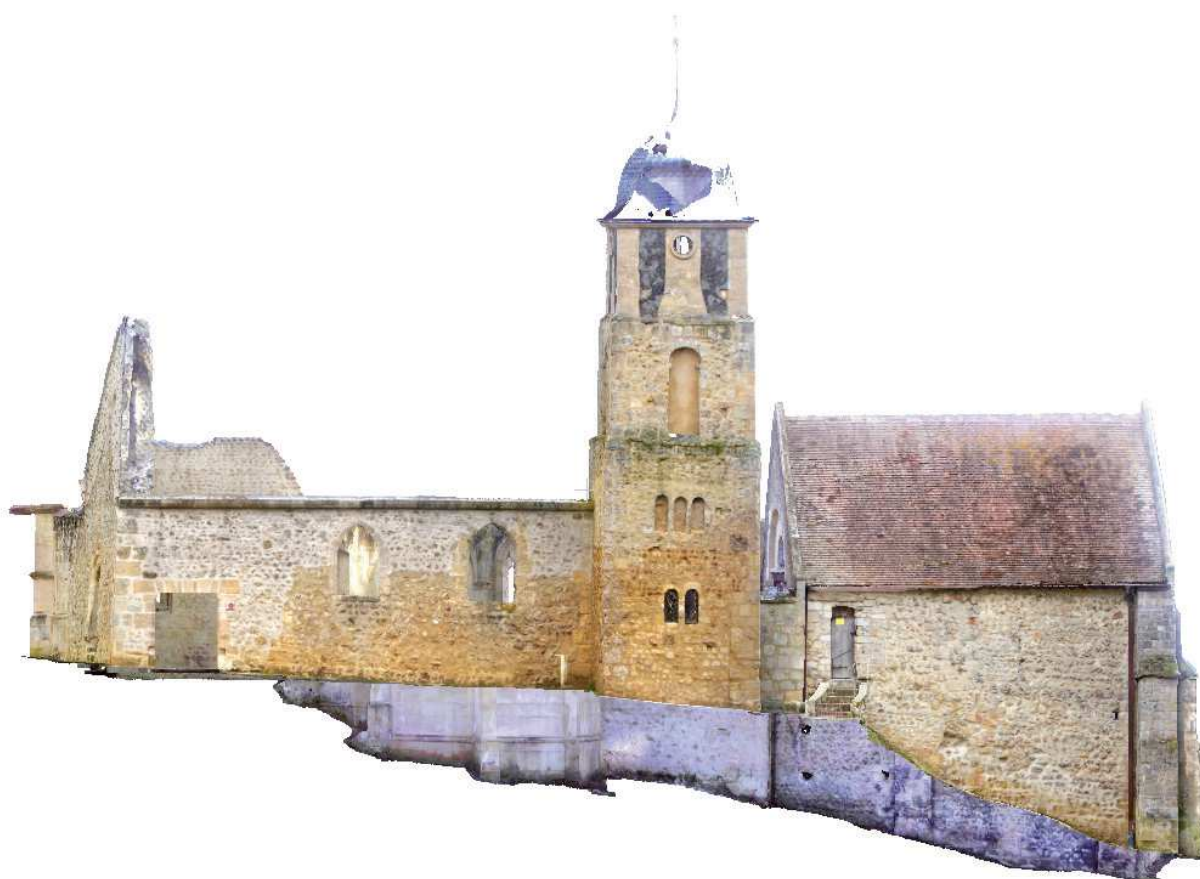
La vue Sud